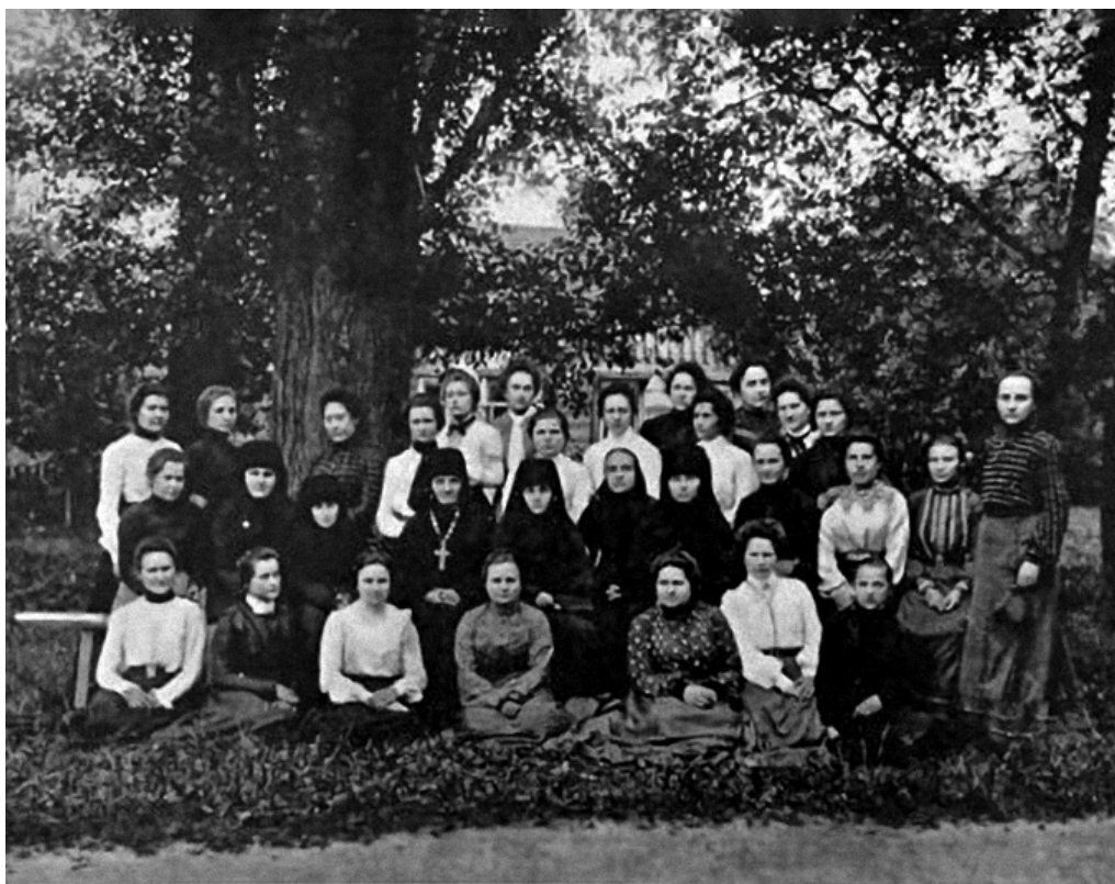
Рис. 2. Группа учительниц церковно-приходских школ Холмско-Варшавской епархии, бывших на курсах при Леснинском монастыре в июле-августе 1903 г. [Памятка, 30]