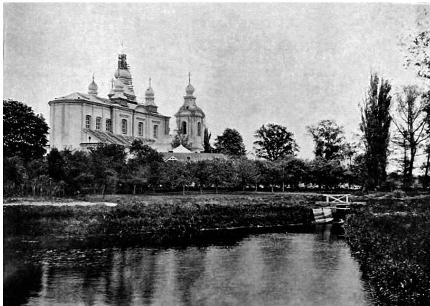
Рис. 3. Вид Монастыря с Юго-Западной стороны из Монастырского сада. [Памятка, 4]